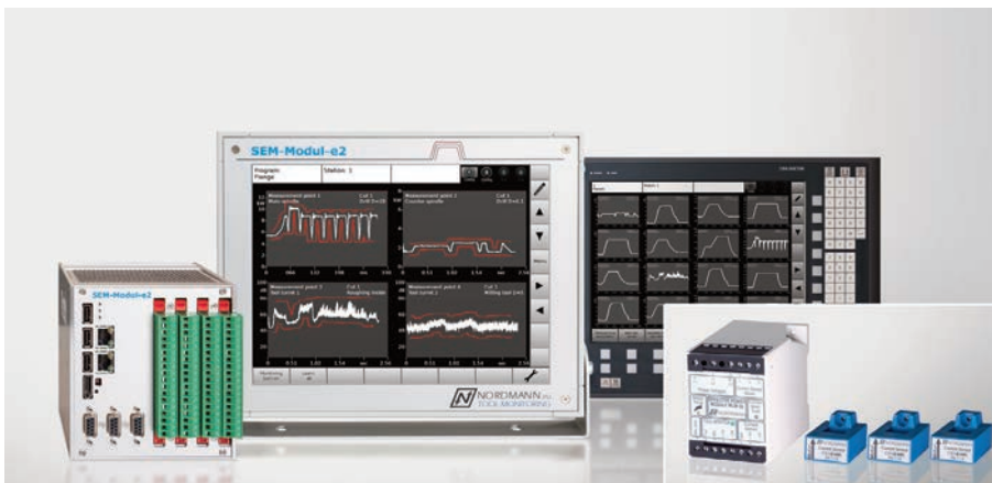
Werkzeugüberwachungssystem SEM-Modul-e2 mit Display – alternativ Anzeige auf der NC-Steuerung – sowie das neue Dreiphasen-Wirkleistungsmessgerät WLM-3S mit drei Stromsensoren (kleines Bild).

Das prozessbegleitende Überwachen von Zerspanungswerkzeugen in Werkzeugmaschinen hinsichtlich Schneidenverschleiß und -bruch erlaubt einen automatischen Werkzeugwechsel erst bei tatsächlich eingetretenem Schneidenverschleiß oder einem Stopp der Maschine im Augenblick eines Werkzeugbruchs. Dies erlaubt eine bessere Ausnutzung der Werkzeuge und gestattet höhere Schnittwerte, da der Fertigungsbetrieb das Risiko von Schäden durch einen Werkzeugdefekt im Griff behält. Doch welche Methode eignet sich zur Werkzeugüberwachung am besten: das Auswerten mithilfe interner Antriebsdaten oder die Wirkleistungsmessung? Der Spezialist Nordmann vergleicht beide Methoden.