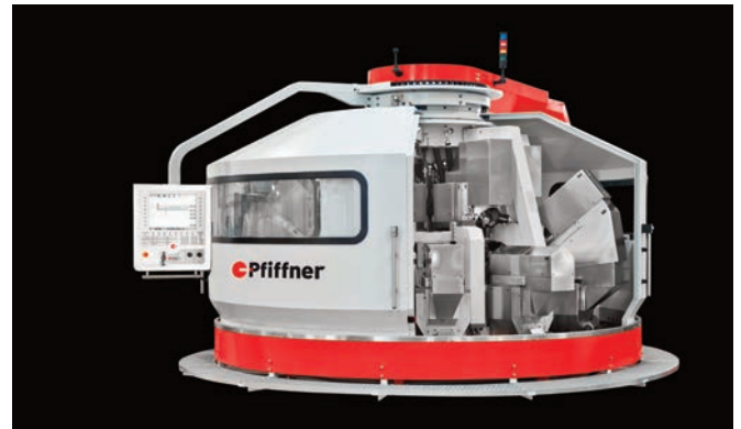
Rundtaktmaschine RT von Pfiffner, auf der die Wirkleistungsmesswerte aus der Grafik gewonnen wurden.

Darüber hinaus ist eine weitere Qualität der Wirkleistungsmessung erwähnenswert: Die Berechnung der Wirkleistung aus einer Messung von Strom und Spannung aller drei Phasen befähigt sogar ganz speziell dazu, eine Dynamik im Zerspanungsprozess abzubilden. Dies zeigt sich am Beispiel eines ratternden Spiralbohrers (siehe Bild bzw. Diagramm 'Vorschubantrieb bei ratterndem Spiralbohrer') mit 8mm Durchmesser in einer Index-Drehmaschine. Die per WLM-3S gemessene Wirkleistung des Z-Achsen-Vorschubantriebs spiegelt deutlich die dynamische Belastung des Vorschubantriebs wider, während diese im Drehmomentwert der internen Antriebsdaten einer Sinumerik 840 D verloren geht. Diese besondere Fähig-